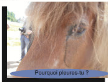
Pourquoi pleures-tu ?

SE : Quand tu aimes le cheval, tu te souviens des noms.