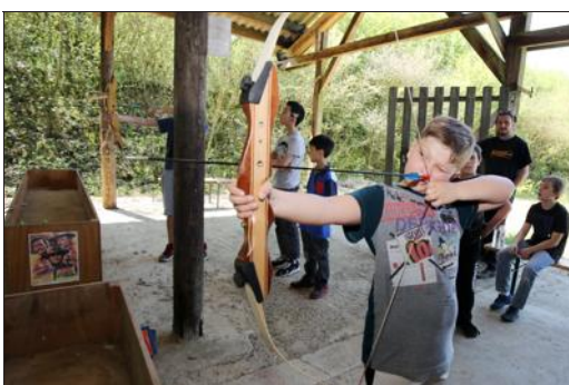
Concentration et précision pour bien viser la cible.

Ce tournoi va laisser la place au tournoi seniors + qui se déroulera du 29 mai au 17 juin.