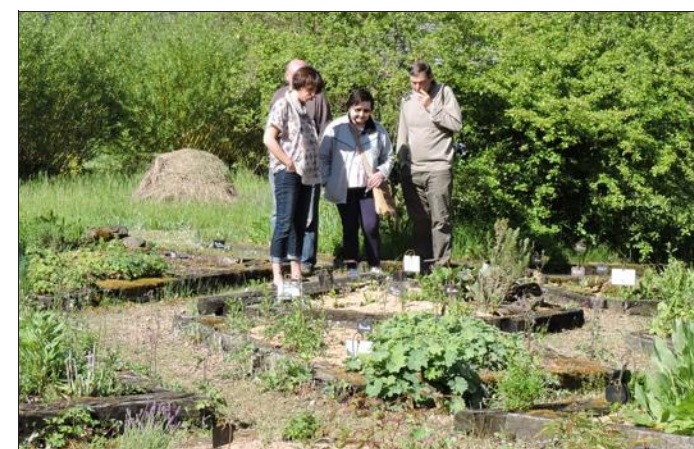
Par petits groupes, les promeneurs ont découvert le jardin des plantes médicinales et aromatiques.