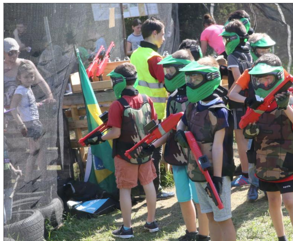
Le paintball plaît davantage aux garçons mais les filles aussi peuvent tester cette activité.

Jeudi 25 mai, de 10h à 12h et de 14h à 18h, à la base de loisirs Solan, 1 hameau de Serry à Moineville. Tél. 03 82 46 66 77.