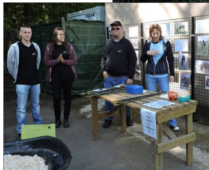
Plusieurs membres de Sauv'Equi étaient présents.

Le monde des insectes et des végétaux fourmille de surprises.