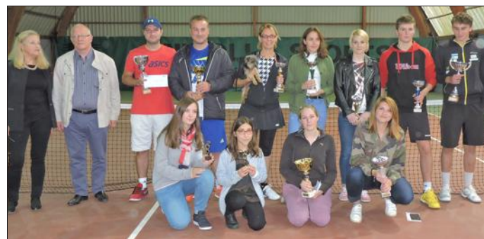
Place désormais au tournoi seniors + qui se déroulera du 29 mai au 17 juin. Avec, cette fois, la possibilité de jouer sous le soleil!