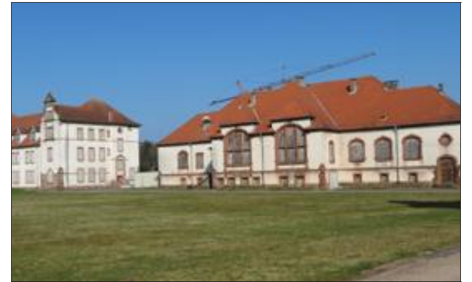
Les anciens bâtiments du 4 e régiment de cuirassiers sont inutilisés depuis 1997.

En projet, la création d'une résidence pour seniors, d'un hôtel de grand gabarit (dont manque cruellement le Pays de Bitche), d'un centre de formation à l'hostellerie de luxe (une demande des professionnels) ainsi que d'un centre de rencontre de vétérans. D'un commun accord avec les acquéreurs, l'ancienne place d'armes restera place centrale, réservée aux piétons et aux cyclistes.