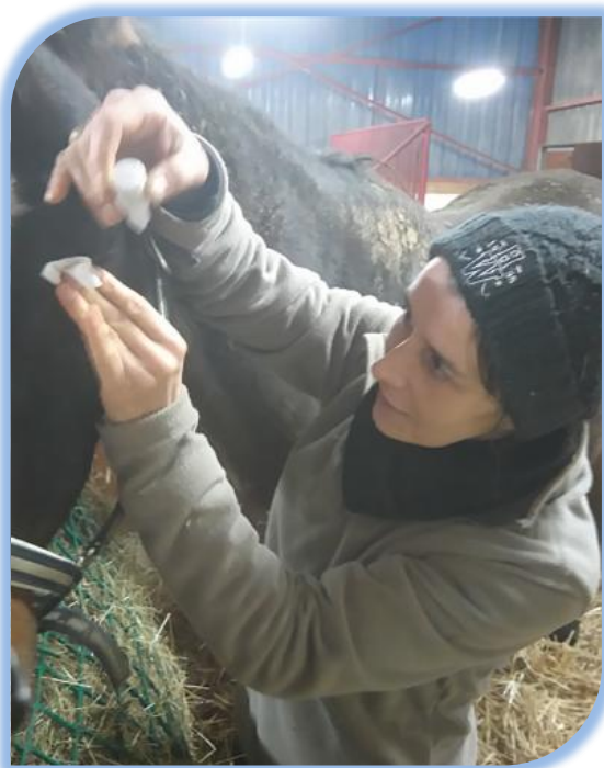
La présidente de Sauv'Equi verse quelques gouttes de collyre dans l'œil de Le Mareyeur. Chaque soin est effectué avec l'accord de nos vétérinaires. Merci à ces spécialistes de nous suivre depuis tout ce temps !