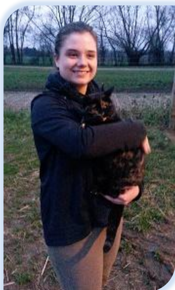
Aurélié et Catapulte, la chatte de l'écurie, là avant qu'on s'installe et restée avec nous. Elle fait partie de la famille !

Pour vivre et continuer à fonctionner, Sauv'Equi a toujours besoin de bénévoles motivés pour renforcer les rangs de son équipe dynamique. Et d'aide financière ! Toutes les sommes versées à notre association sont déductibles des impôts à hauteur de 66% pour les particuliers (100 € revient, au final à 34 € ; 50 € à 17 €) et de 60% pour les entreprises. N'hésitez pas ! Sans vous, sans nous, Sauv'Equi ne pourrait pas continuer alors qu'elle a encore tant à faire pour la protection des équidés !