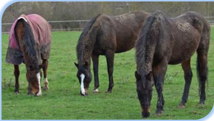
Surfing Dubb (au premier plan) et ses amis se dégourdisent les membres chaque jour dans leur parc, profitant du moindre brin d'herbe.